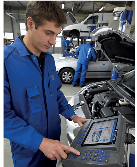
À l'atelier, le travail avec les testeurs de diagnostic et la correction des erreurs logicielles via des mises à jour font partie du quotidien et nécessitent une formation initiale et continue approfondie.

mises à jour « over-the-air », qui rendraient un détour par le garage superflu, reste toutefois une chimère pour de nombreuses marques. Afin d'équiper un appareil de commande d'un nouveau logiciel d'exploitation et d'application sans crash ni panne, la tension de fonctionnement du réseau de bord doit être suffisamment élevée, le contact doit être mis et coupé plusieurs fois chez certains fabricants et la