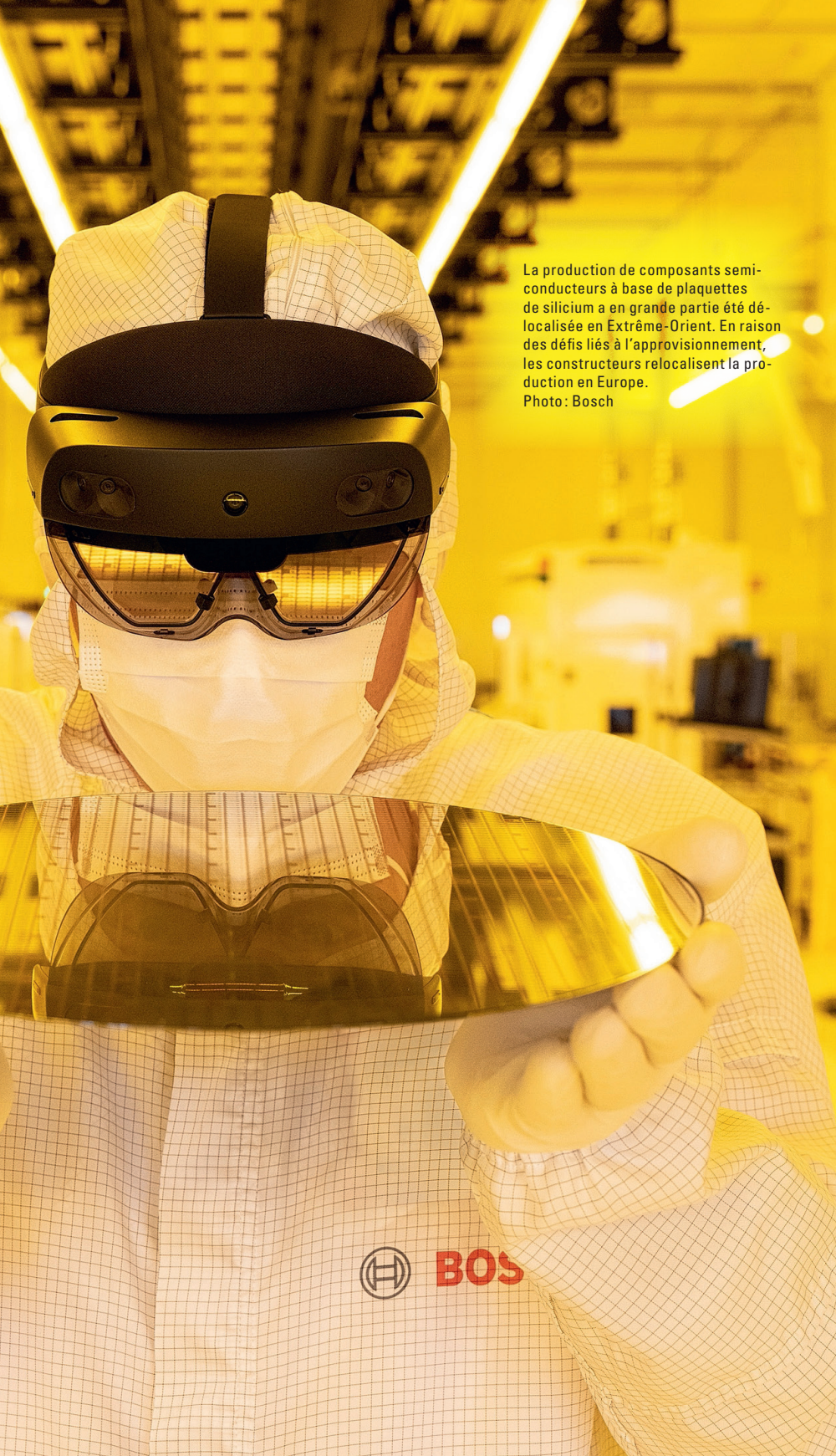
La production de composants semi-conducteurs à base de plaquettes de silicium a en grande partie été délocalisée en Extrême-Orient. En raison des défis liés à l'approvisionnement, les constructeurs relocalisent la production en Europe.